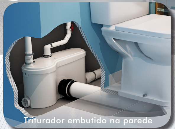
Triturador embutido na parede